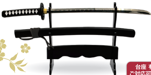
サイズ=本体全長183mm、鞘入り全長200mm