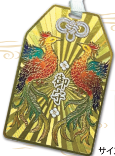
サイズ=62*41mm (プレート部分)