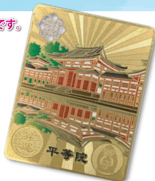
(↑サンプルとしてお作りしたものです。)