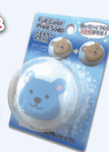
(パッケージご参考)