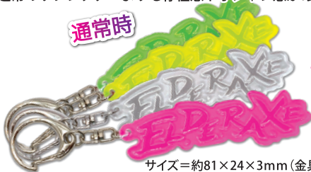
サイズ=約81×24×3mm (金具含まず)