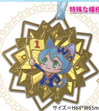
サイズ=H64*W65mm (プレート部分)

特殊な模様が入ったエッチング加工のしおり、カードです。美術品やキャラクター等のグッズにおすすめです。