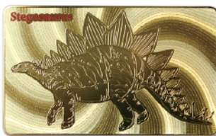
(↑単色印刷もございます。)