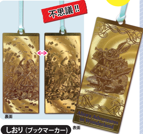
しおり (ブックマーカー) 表面