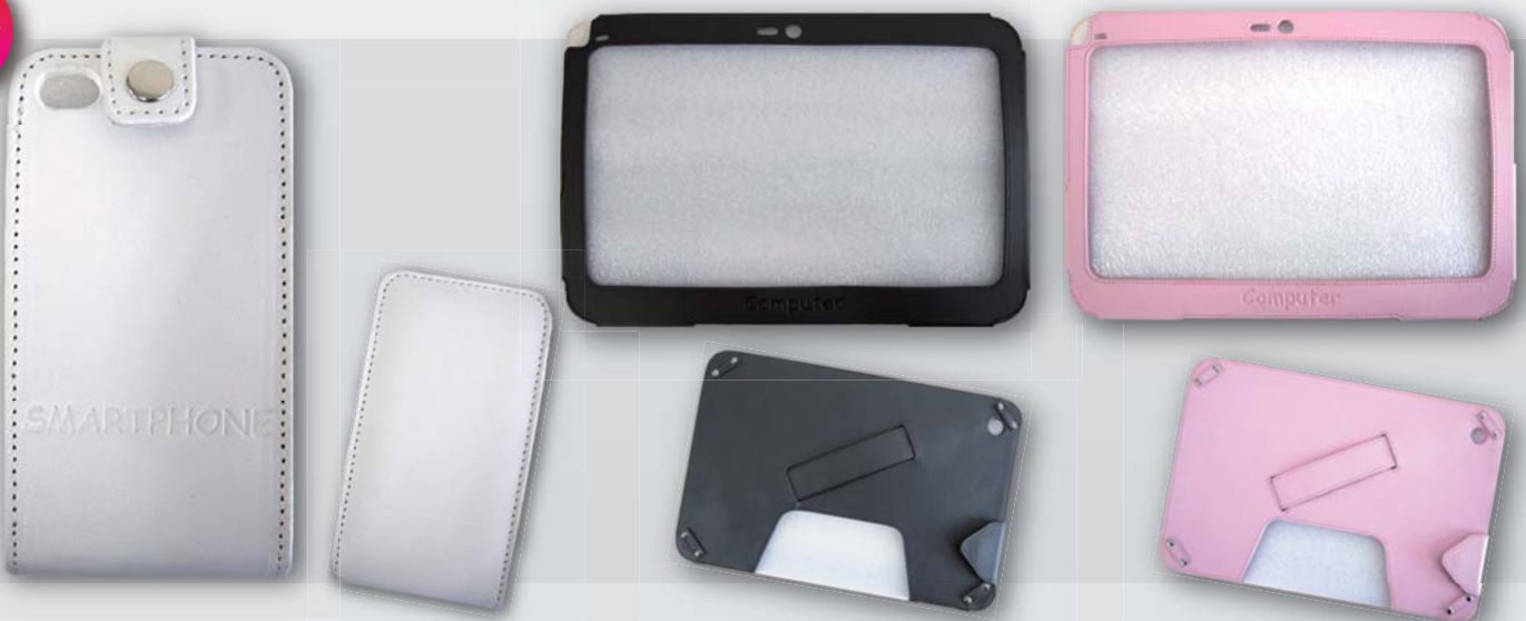
スマホケース<iPhoneサイズ> OEM