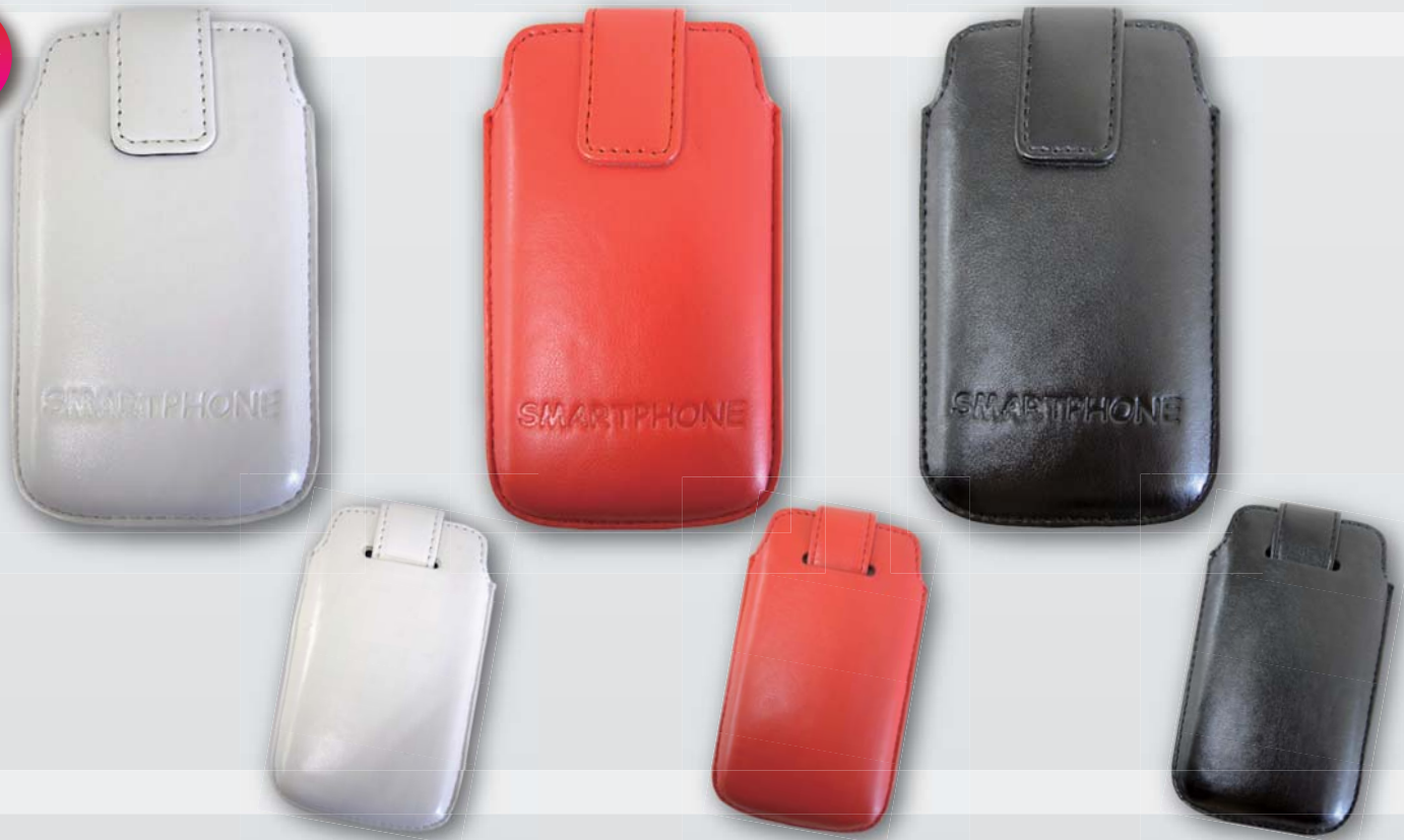
スマホケース<フリーサイズ> OEM